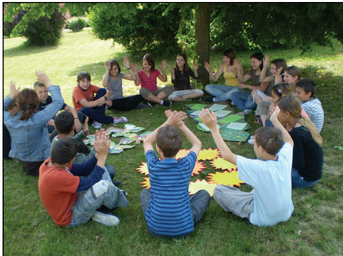
Učenici 6.c razreda raduju se slikovnicama na satu razrednog