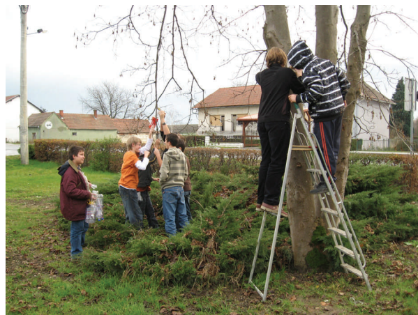
Postavljanje kućica za ptice u školskom dvorištu