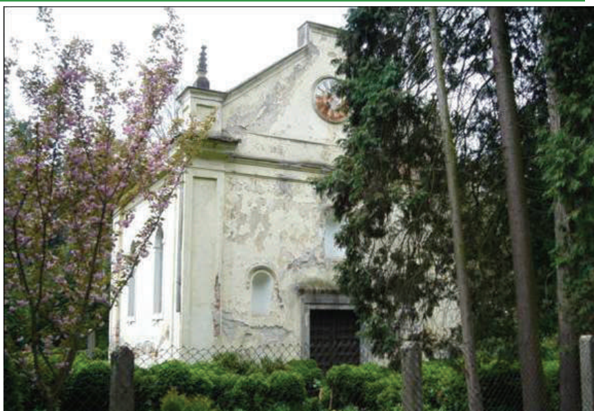
Kapelica sv. Donata

Povijesnu šetnju s učenicima započela je učiteljica povijesti pokazavši im već u 10. mjesecu prezentaciju – povijest Zelendvora. U središnjem prostoru škole učenici su uz priču i fotografiju saznali osnovno o imenu, vlasnicima, stanovnicima Zelendvora kroz povijest. Ti će im podaci dobro doći i u ostvarivanju zadataka u drugim nastavnim područjima.