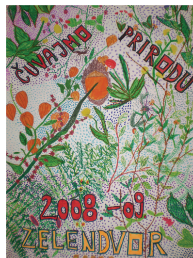
Plakat posvećen projektu Zelendvor – dar prirode