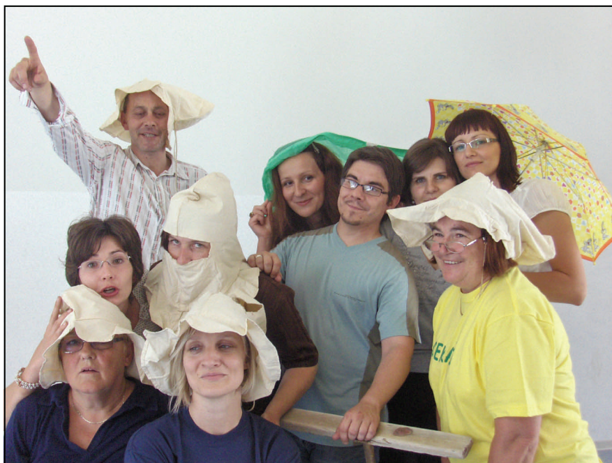
Vesela proba glumačke družine

zbunjene u predstavi naših Tralalalalala, kazališne družine odraslih OŠ Petrijanec. Predstava nosi naslov „Jednog dana u Zelendvorskoj šumi ...“.