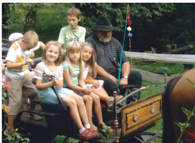
Dječji rođendan u Zelendvoru

Motivirali smo učenike i šetnjama u Zelendvoru u okviru nastave TZK, ekološke grupe, geografije, razredne nastave... Prikupili smo i fotografije naših učenika iz Zelendvora pod naslovom “Djetinjstvo i rođendani u Zelendvoru”