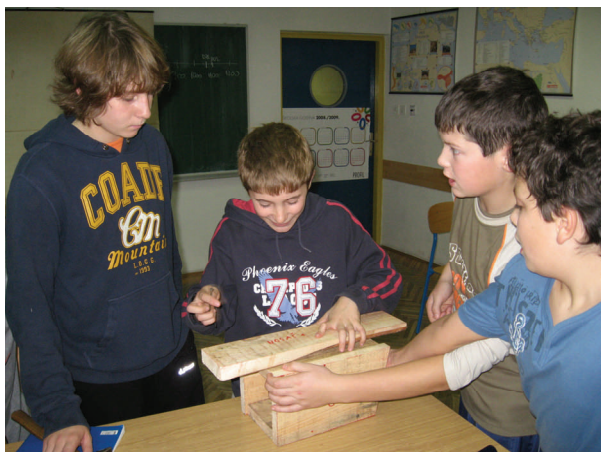
Izrada kućica za ptice

U naš projekt aktivno su se uključili i članovi eko—grupe te su u korelaciji s nastavom prirode i tehničkog odgoja napravili kućice za ptice. Marljivo su radili te napravili nekoliko drvenih i plastičnih kućica koje su zatim s velikim oduševljenjem postavljali u dvorištu škole. S izradom kućica nastaviti će i u sljedećoj školskoj godini te ih postaviti na drveće u Zelendvorskoj šumi.