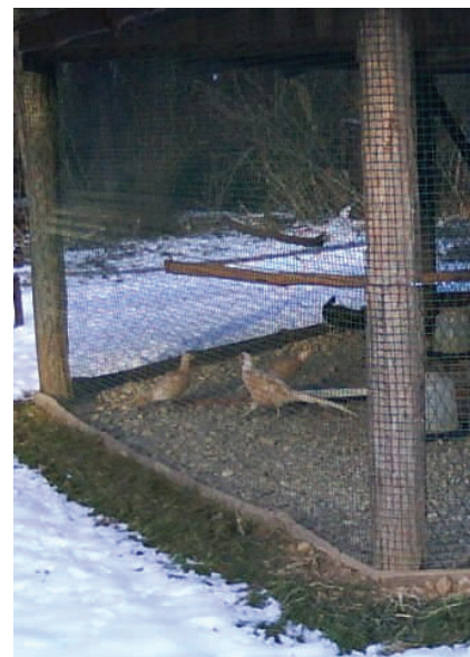
Hranilište za fazane