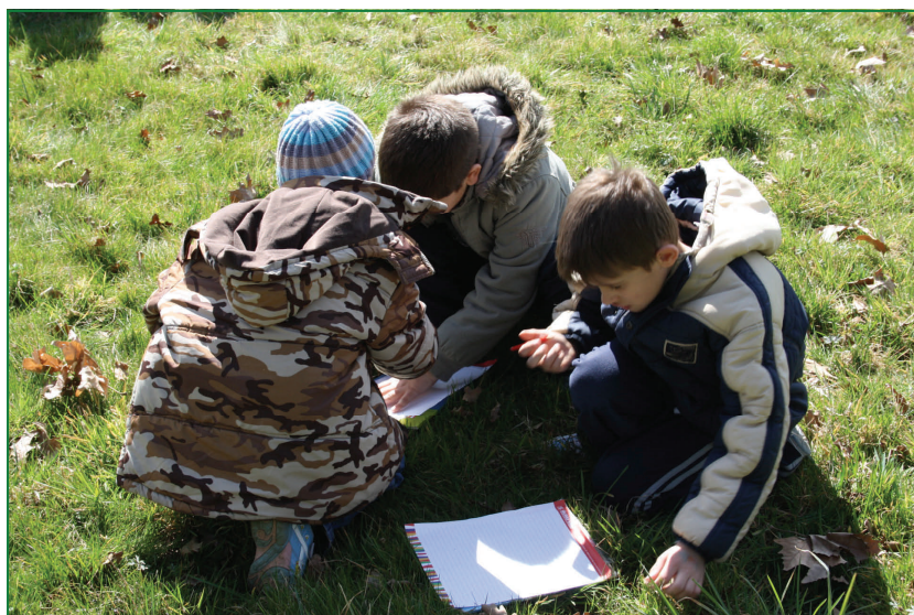
Učenici trećih razreda uče u Zelendvoru